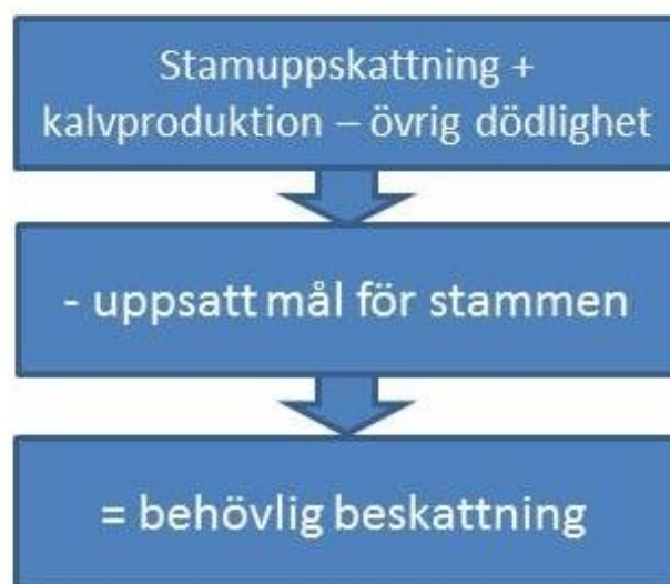
Beskattningsberäkningens grundstruktur i förenklad version.

förvaltningsområdena om älgstammens storlek och struktur samt fortplantning och utveckling. Viltforskningen producerar dessutom för beskattningsplaneringen så kallade beskattningsscenarioer, dvs. prognoser för den beskattning, med vilken man uppnår de uppsatta målen inom en viss tid. Vid beskattningsplaneringen kan vid behov även användas andra tillgängliga uppgifter, såsom resultaten från olika lokala inventeringar