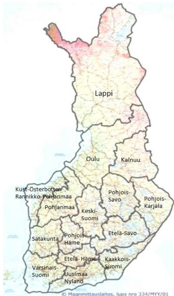
Verksamhetsområdesgränser för Finlands viltcentral och de regionala vilträden

och de fastställda målen för älgstammen ska vara färdiga senast i slutet av mars, när planeringen av älgbeskattningen inleds. Eftersom gränserna för älgförvaltningsområdena avviker från gränserna för viltrådets verksamhetsområden, ansvarar det regionala viltrådet, till vars verksamhetsområde den största delen av älgförvaltningsområdet hör, för hörandet av intressegrupperna och uppsättningen av målen.